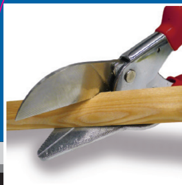
Anvil for mitre cuts Sécateur pour les coupes d'onglet